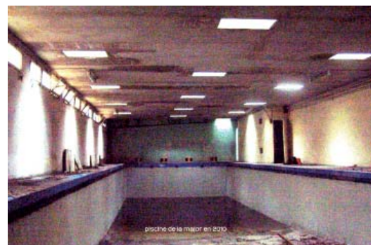
Vision de la piscine de la Major telle qu'elle est aujourd'hui...