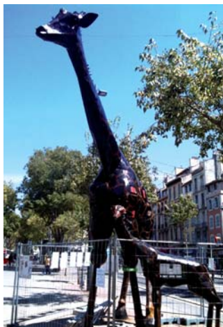
Zarafa III et Marcel Zarafon

Toujours en son souvenir et pour la cause du livre encore, voici donc aujourd'hui "Zarafa III" accompagnée de "Marcel Zarafon" son girafon, tous deux en acier cette fois. C'est l'association "Art Book Collectif", un groupe de plasticiens marseillais et toulousains (suite en page 2)