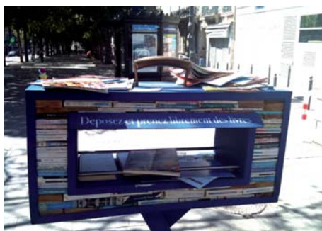
"Borne aux livres" Aout 2010

bornes, ou l'on peut prendre des livres gratuitement, mais aussi en amener ou en échanger. L'incendie de Zarafa II, qui