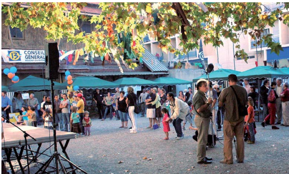
Forum des associations du 2 ème secteur édition 2009

Six ans déjà que le "Forum des associations du 2 ème secteur" est inscrit en gras dans nos agendas ! Devenu incontournable, il permet en effet de présenter aux habitants et de la meilleure manière qui soit, toutes les associations sportives, culturelles ou de loisirs que comptent nos arrondissements. (suite en page 2)