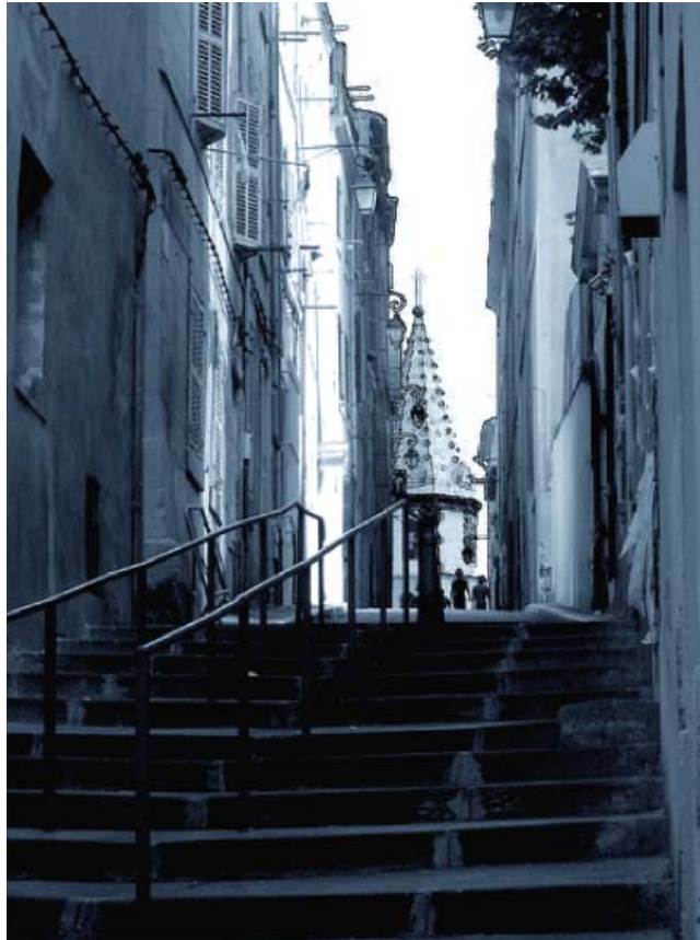
Montée des Accoules

D'ailleurs les perspectives sont bonnes pour les malfrats, car plus ce quartier deviendra beau, riche et célèbre, plus leur avenir est assuré ! Dormez en paix braves gens... CP